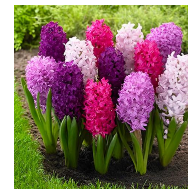
Pista nº 4

¡Comienza la gran aventura de los retos "EN BUSCA DEL LIBRO PERDIDO"! CADA MES se publicará en la página web, redes sociales del centro y en vuestro tablón de clase UN RETO con una serie de PISTAS que os conducirán a un AUTOR/A Y SU LIBRO en lengua castellana, francesa o inglesa. Tendréis que resolver el enigma antes de la finalización de cada mes. El equipo más rápido en hallar la solución obtendrá 1 PUNTO, y aquel equipo que acumule más puntos será recompensado a final de curso con una ¡¡¡SORPRESA!!!.