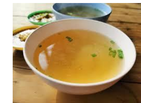
Pista nº 3