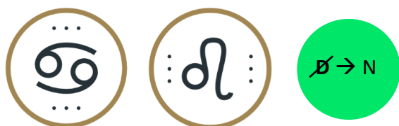
Pista n° 1