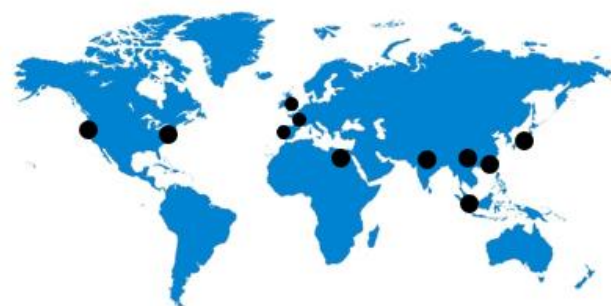
Pista n° 2