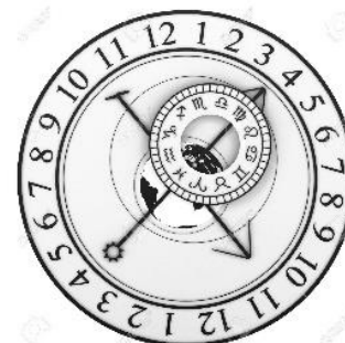
Pista n° 3