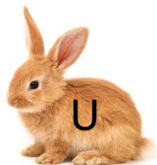
Pista n° 2