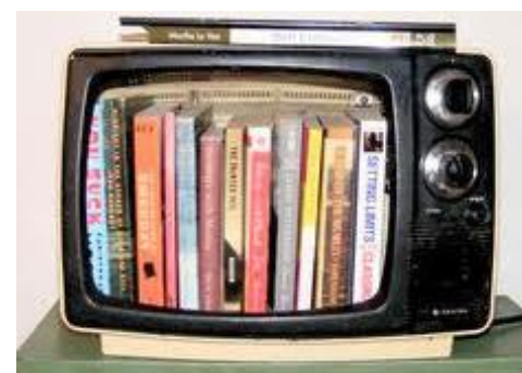
Pista n° 3