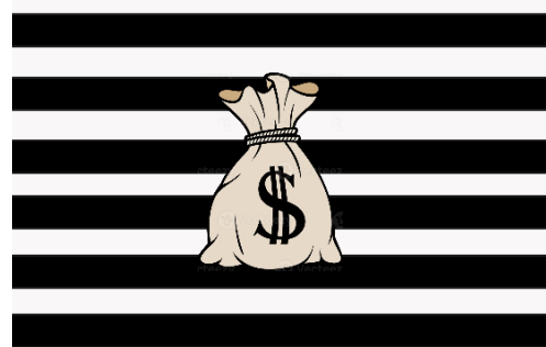
Pista n° 1